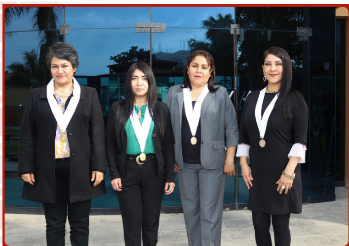
Magistrados y magistradas del Módulo Judicial Integrado en Violencia contra las Mujeres e Integrantes del Grupo Familiar, en la Sede del Adulto Mayor en Chorrillos.