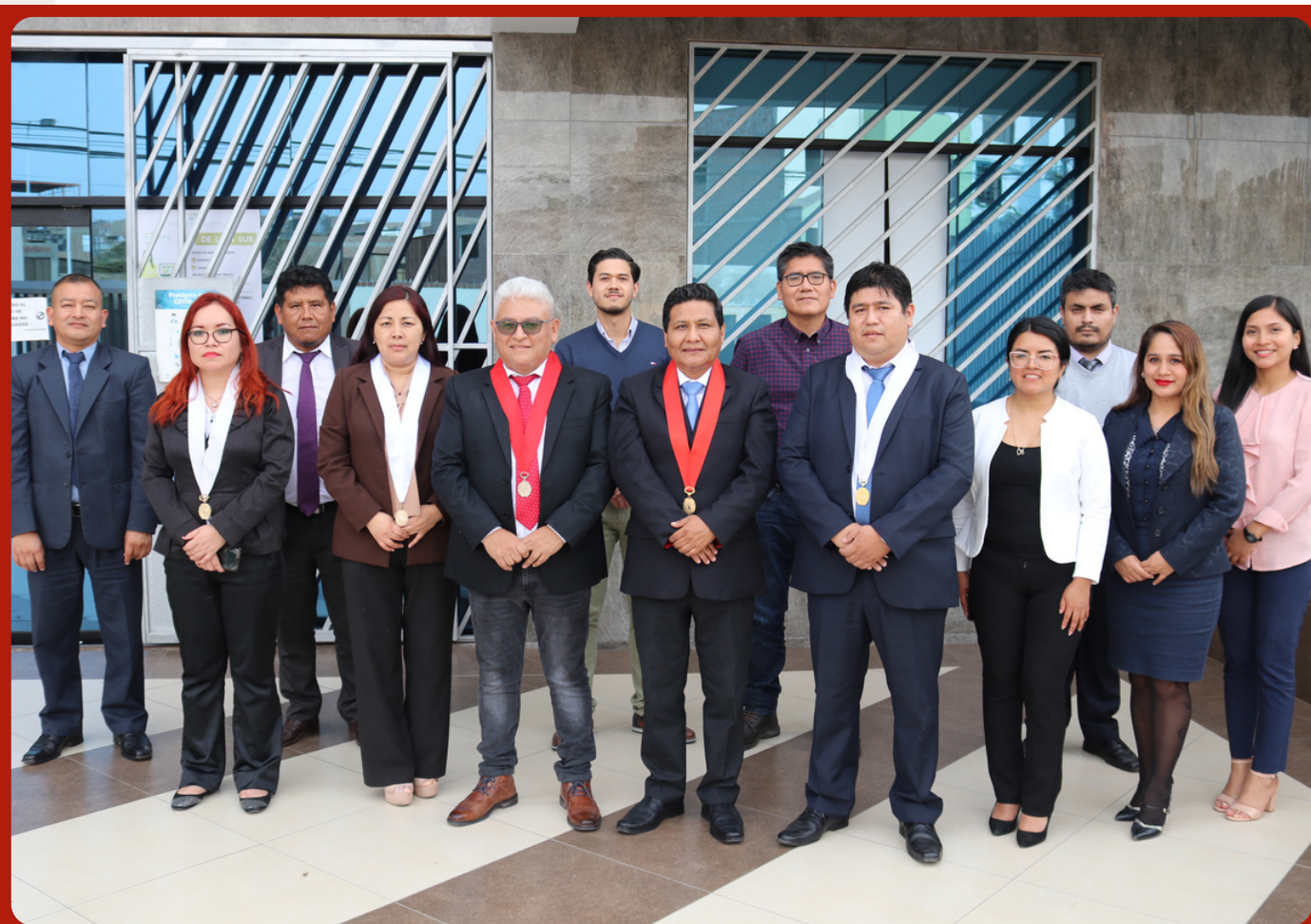
Jueces y juezas superiores y especializados del Nuevo Código Procesal Penal de la Sede Villa Marina II, en el distrito de Chorrillos, junto a su personal jurisdiccional y administrativo de la Corte Superior de Justicia de Lima Sur.