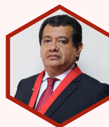
Vicente Flores Arrascue Juez Superior