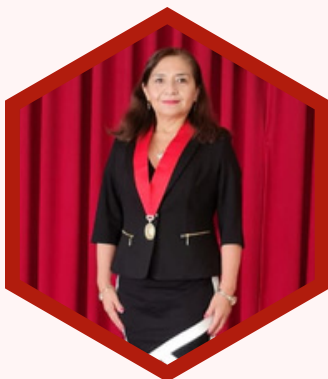
Emperatriz Tello Timoteo Presidenta