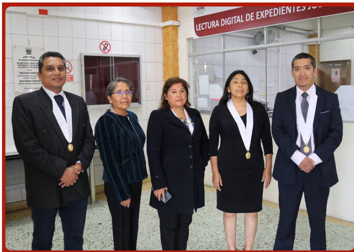
Magistrados y magistradas del Módulo Judicial Integrado en Violencia contra las Mujeres e Integrantes del Grupo Familiar, en Villa El Salvador