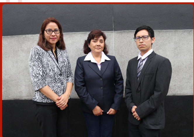
El personal de la Oficina de Secretaría Técnica de Procedimientos Administrativos Disciplinarios de la Corte Superior de Justicia de Lima Sur.