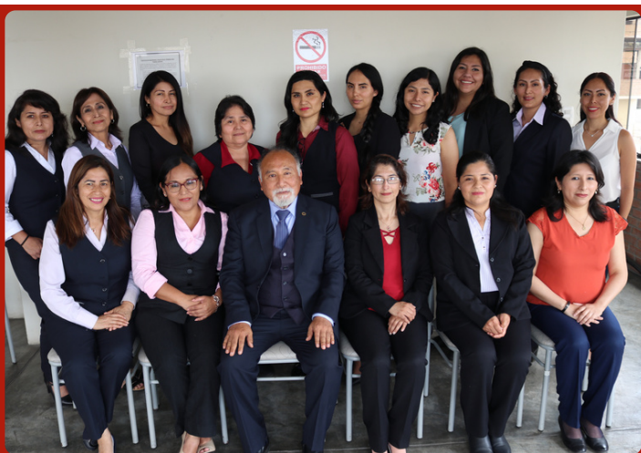
Los miembros del Equipo Multidisciplinario PpR Familia de la Corte Superior de Justicia de Lima Sur, .