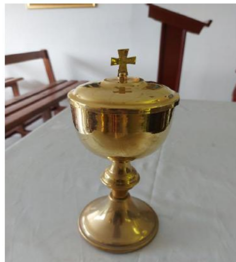
UN COPON DE MISA CON TAPA DORADO