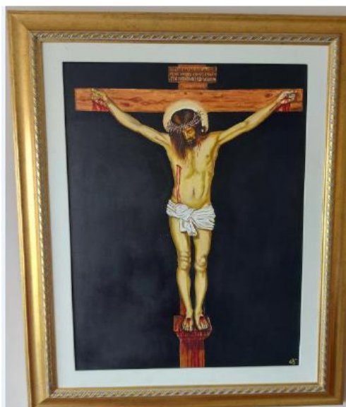
CUADRO DE CRISTO CRUCIFICADO