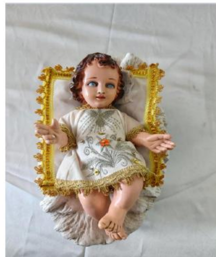
IMAGEN DE NIÑO JESUS