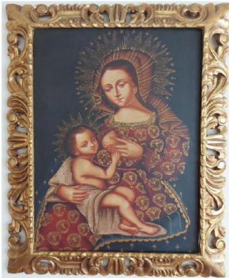
CUADRO DE LA VIRGEN MARIA Y DEL NIÑO JESUS