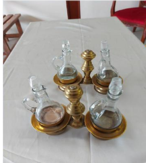
DOS VINAJERAS DORADAS CON BOTELLITAS CON TAPA DE VIDRIO