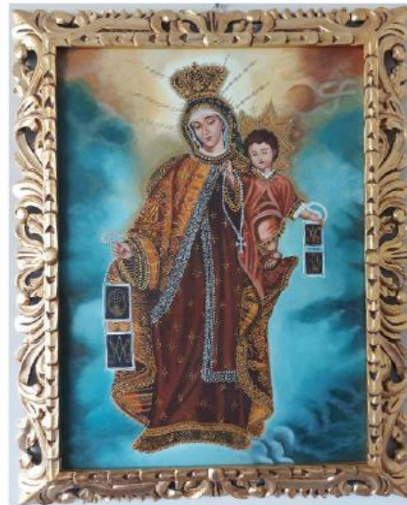
CUADRO DE LA VIRGEN DEL CARMEN Y EL NIÑO JESUS