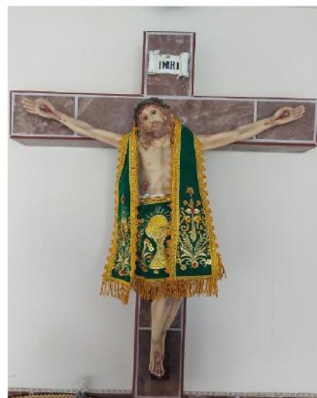
IMAGEN DE CRISTO CRUCIFICADO