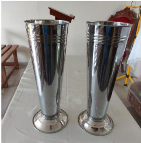
DOS FLOREROS DE MATERIAL PLATEADO