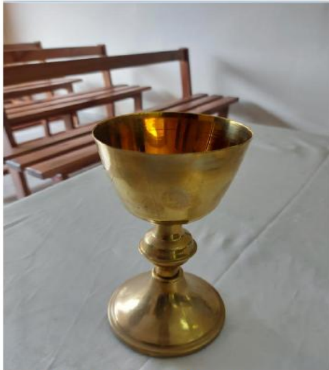
CALIZ DE MISA DORADO SIN TAPA