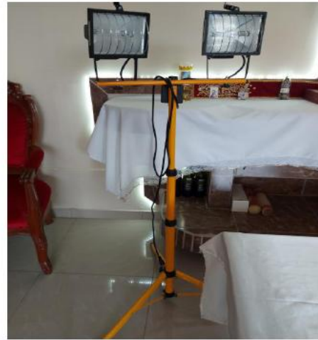
UN REFLECTOR DE PEDESTAL CON DOS TACHOS DE LUZ