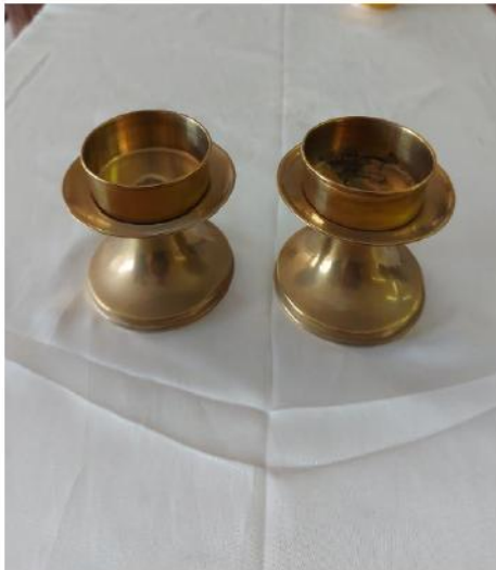
DOS CANDELABROS DORADOS